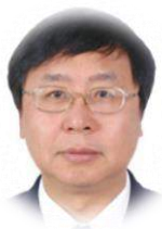
曲久辉 教授 中国工程院 院士 美国工程院 院士 中国科学院生态环境研究中心 教授