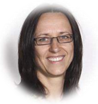
Ana DELETIC 教授 澳洲新南威尔士大学 副校长