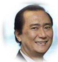
Eng-soon CHAN 教授 新加坡国立大学 教授 新加坡海事与岸外工程 科技中心 行政总裁