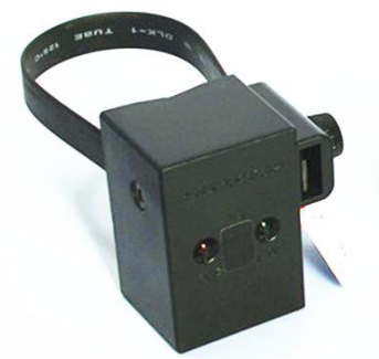
图一、电缆型短路故障指示器

电缆型短路故障指示器是 6-110KV 线路用来检测短路故障点的装置。是利用线路出现短路故障时电流正突变及线路停电来检测故障点。